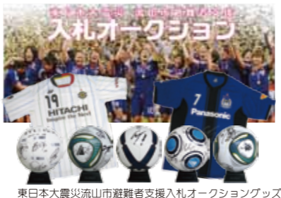
東日本大震災流山市避難者支援入札オークショングッズ

なでしこジャパン澤選手、横浜Fマリノス中村俊輔選手、 柏レイソル山中亮輔選手他のサイン入りグッズを入札でゲット！ 【入札期間】 3月1日(木)~4月5日(木) 【入札場所】 ケーズデンキ流山店 [10:00~18:00] 流山おおたかの森駅コンコース [10:00~18:00] (3月20日から5月1日) 流山おおたかの森駅 3F bayfm スタジオ前 [10:00~18:00] (3月1日から3月19日) 流山市役所ロビー [10:00~17:00] (土日祝日を除く) 流山市生涯学習センター [10:00~17:00] (3月21日休館日)