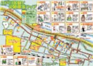
江戸川景観史跡散策マップ

江戸川からの菜の花をゆったりと遊覧船で満喫。 また東京スカイツリー眺望のベストポイントにもご案内！ ※チケット販売は流山キッコマン広場にて(300円)