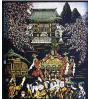
飯田信義さんの作品 「MATSURI JAPAN」