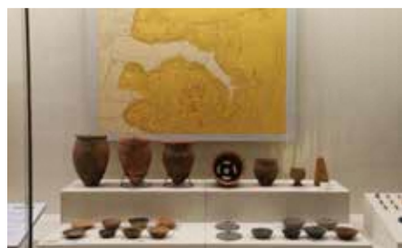
加町畑遺跡出土の奈良・平安時代土器 (市立博物館展示)

三輪野山には台地北端に式内社とされる三輪茂侶神社が祀られており、神社西側に三輪野山北浦遺跡、南側に三輪野山宮前遺跡・三輪野山道六神遺跡という奈良・平安時代の遺跡があります。三輪野山北浦遺跡では、奈良・平安時代の竪穴住居跡が29軒調査され、平安時代の住居から下総国分寺の屋根瓦と同じ宝相華文をもった軒丸瓦や役人が付けた腰帯の金具である巡方が出土しています。三輪野山道六神遺跡では奈良・平安時代の竪穴住居跡が135軒見つかっています。流山北小学校と文化会館前の坂道を上った台地一帯が加町畑遺跡です。奈良・平安時代の竪穴住居跡が125軒、倉庫と考えられる掘立柱建物17棟が調査