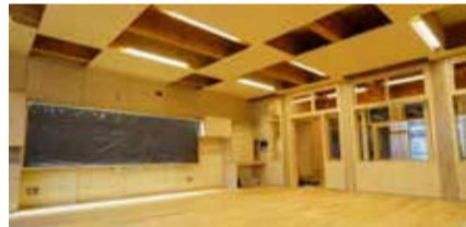
千葉県産材を活用した 木質空間・木造校舎

なお、おおぐろの森小学校の始業式は4月5日、入学式は4月8日に実施予定です。詳細は市ホームページまたはおおぐろの森小学校のホームページをご覧ください。 問学校施設課☎7157-2755 ID1028751