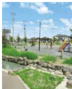
西平井・鱈ヶ崎地区

※千葉県の宅地は、敷設していません。詳細は千葉県流山区画整理事務所にお問い合わせください。