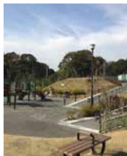
鱈ヶ崎・思井地区