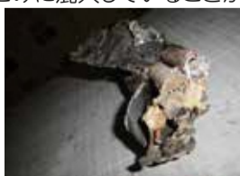
燃えた充電式電池