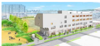
(仮称)南流山地域図書館・児童センター 外観パース

新型コロナウイルス感染症の影響が世界中で確認されて以来、早くも1年以上が経過しました。オンライン会議やテレワークなど、ビジネススタイルの変化や、店舗の営業形態など、人々の生活様式が大きく変容してきました。こうした状況の中にあっても、本市の人口は順調に増加し、去る1月6日には、20万人を超えました。本市は都心への利便性の高さから首都近郊ベッドタウンとして、多くの市民が都心などへ通勤や通学をしていますが、新型コロナウイルス感染症拡大の影響が懸念される中、テレワークや在宅勤務などのリモートワークが急速に普及し、日中、市内で過ごす市民の割合が高まってきました。