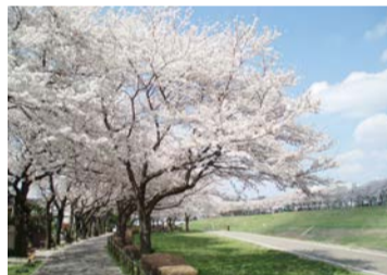
眺望の丘付近の桜並木