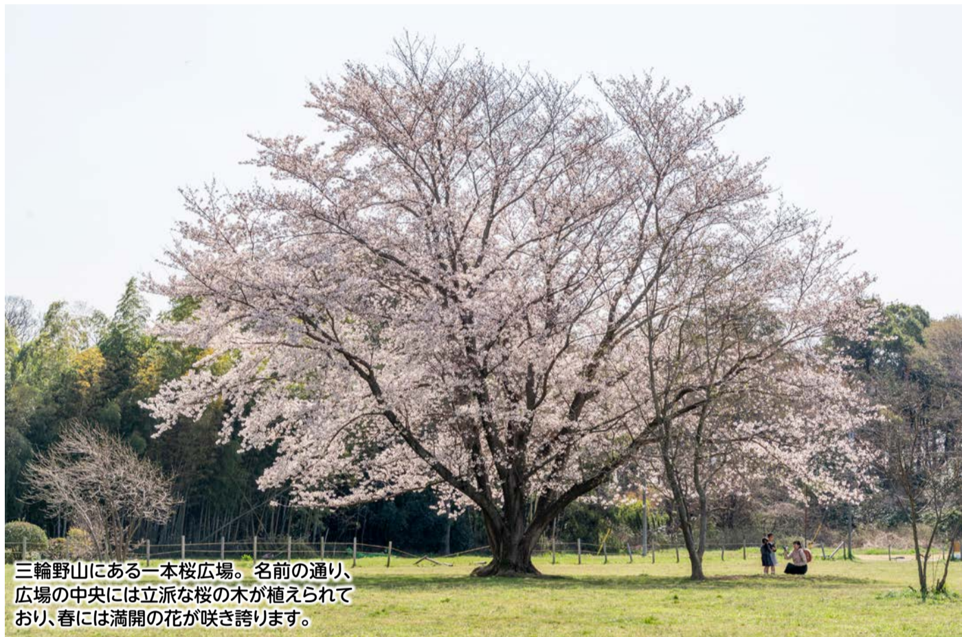
三輪野山にある一本桜広場。名前の通り、広場の中央には立派な桜の木が植えられており、春には満開の花が咲き誇ります。

2月18日に令和3年流山市議会第1回定例会が開会され、その冒頭、井崎市長が新年度の経営方針や主要事業を示しました。今号では新年度に向けた基本的な考えについて、その概要を紹介し、全文は、市ホームページでご覧になれます。なお、主要事業については、4月1日発行の特集号「ことしは、これをやります。」でお知らせします。