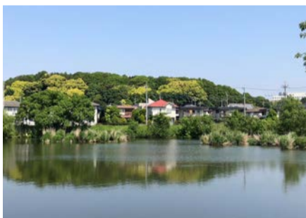
みやぞの野鳥の池からの眺め。水と緑の空間が住宅地と調和しています。

また、児童・生徒数の増加による学校整備や保育園の整備などの喫緊の課題および経済支援や生活支援に加え、東京