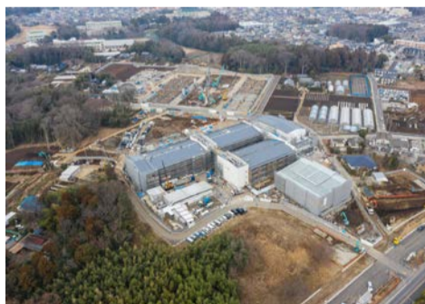
小学校の建設状況

また、開校を記念して、4月3日に新設を祝つ会および施設見学会(4面参照)を開催します。