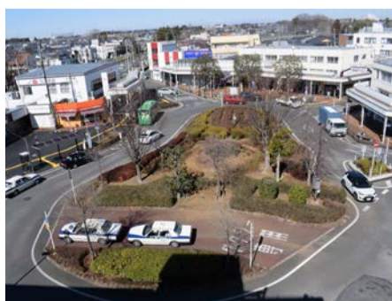
現在の江戸川台駅東口駅前広場

オリンピック・パラリンピックに向けた準備、将来を見据えたツーリズム施策等への布石など、流山市政の進展を止めることなく、その歩みを着実に進めていきます。