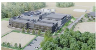
中学校の完成イメージ

おおぐろの森中学校は、令和4年4月の開校に向けて、東棟および西棟では基礎躯体工事、体育館棟およびプール棟では土工事を実施しています。