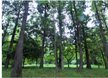
理窓会記念自然公園の自然林