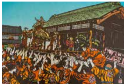
浅間神社祭り(ババリ日本選抜作家展出品)

日 2月1日(月)～7日(日)9時～17時(1日は13時から、7日は16時まで) 所 流山おおたかの森駅前観光情報センター 定 5人(入替制) ※鑑賞時間を設定する場合あり 費 無料 持 マスク 問 流山おおたかの森駅前観光情報センター ☎7186-7625