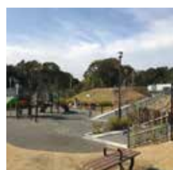
鱈ヶ崎・思井地区