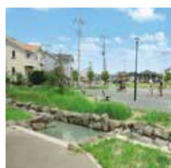
西平井・鱈ヶ崎地区