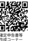
確定申告書作成コーナー