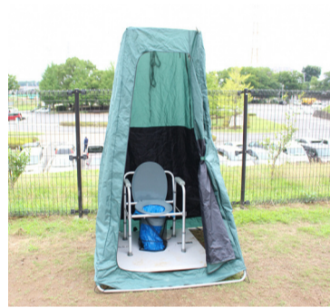
市総合運動公園に整備した防災施設