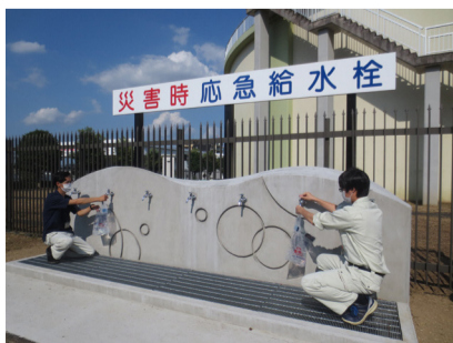
おたかの森浄水場応急給水栓