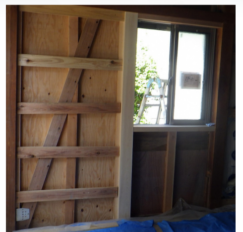
耐震改修例 大きな窓を小さな窓に変更(右側)、耐力壁を新設(左側)