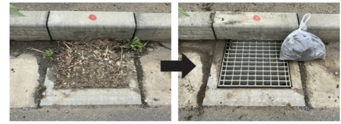
側溝管理課 ☎7150-6093 ID 1027471

ふたの上のごみを取り除くだけでも冠水防止に効果があります。これからの台風シーズンだけでなく、日ごろからご自宅前の側溝や雨水ます周辺の清掃にご協力をお願いします。