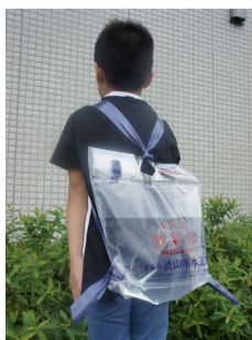
小学生でも持ち運びしやすい給水用水袋