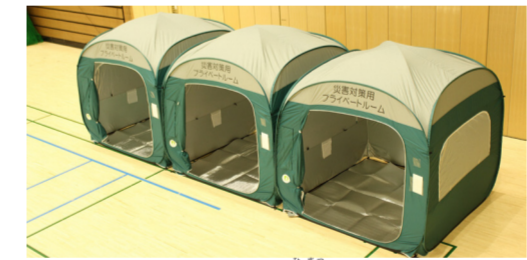
避難所の感染症対策に整備した飛沫感染防止のテント

新型コロナウイルス感染症が蔓延する状況下で、避難所を開設する場合には、感染症対策を講じます。