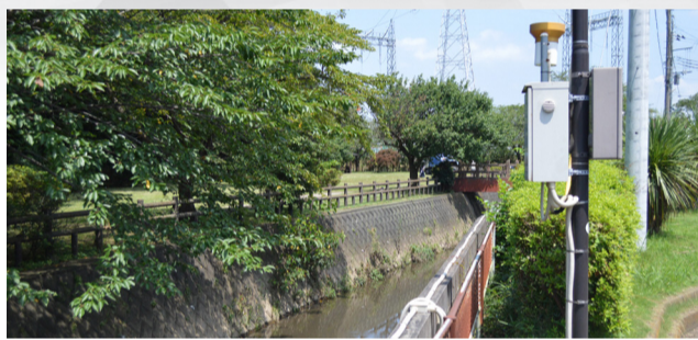
水位監視装置(右側)が設置されている和田堀都市下水道