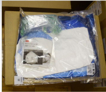
防護服やマスクなどの个人防护具