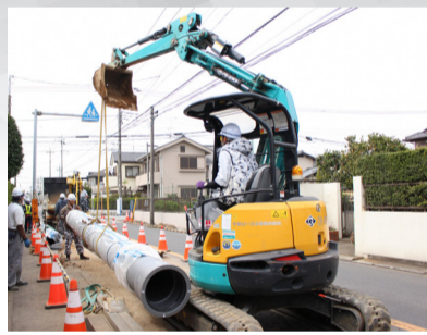
耐震管敷設工事の様子