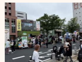
▲イベント開催時の様子