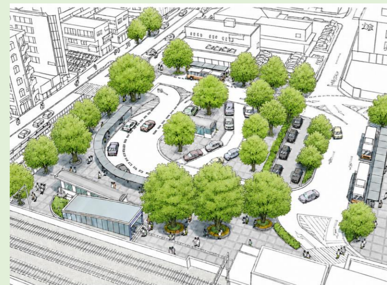
▲全体鳥瞰図(北口駅前広場)