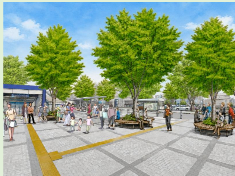
▲改札口から眺めた様子(北口駅前広場)