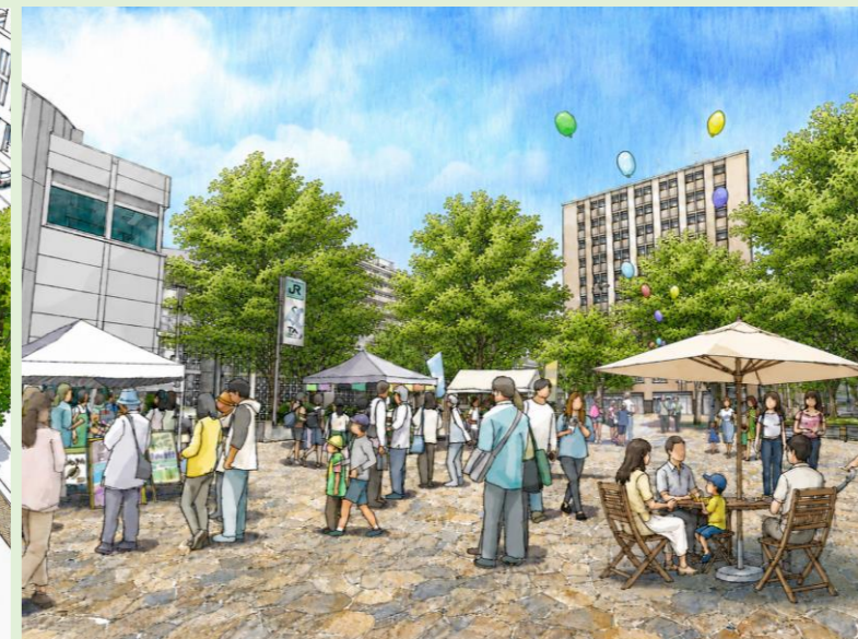
▲イベント開催時の様子(南口駅前広場)