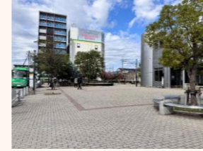
▲南口駅前広場 (現状)