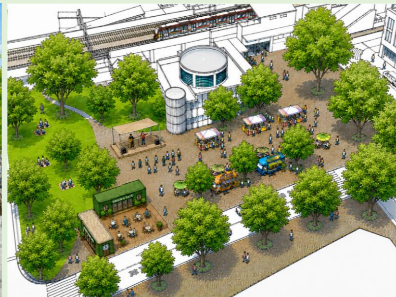
▲全体鳥瞰図(南口駅前広場)