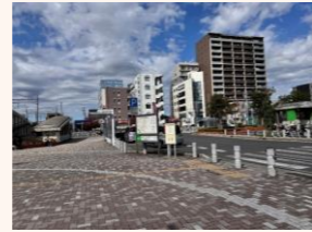
▲北口駅前広場 (現状)

南流山駅の利用者数は増加傾向の一方で、駅前には訪れる人が少なく、通過が中心の空間になっています。本計画は、駅前広場の整備を起点として、 周辺民有地の更新誘導 や 沿道空間の形成 、さらには 駅周辺における回遊性の向上につなげる ことを目的としています。なお、本計画の対象区域は、 南流山駅の北口駅前広場および南口駅前広場 とします。