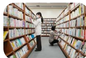
新たな装いとなった館内の様子

床がカーペット敷きになり、足音を気にせずより快適に過ごせるようになりました。また、赤ちゃんほっとスペースやバリアフリースペースが整備されるなど、どなたでも安心して利用できる空間になりました。