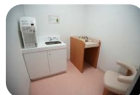
赤ちゃんほっとスペース