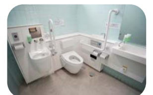
バリアフリースペース