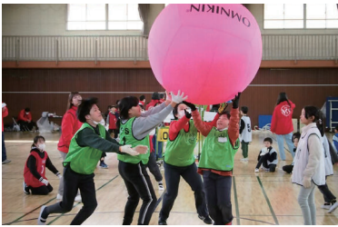
キンボールの様子