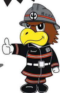
流山市消防本部 マスコットキャラクター おおたかくん

住警器未設置の場合は、すぐに取り付けましょう! お近くのホームセンターや家電量販店、インターネットショップなどで購入できます。 住警器は定期的な点検と交換(10年目安)が必要です。