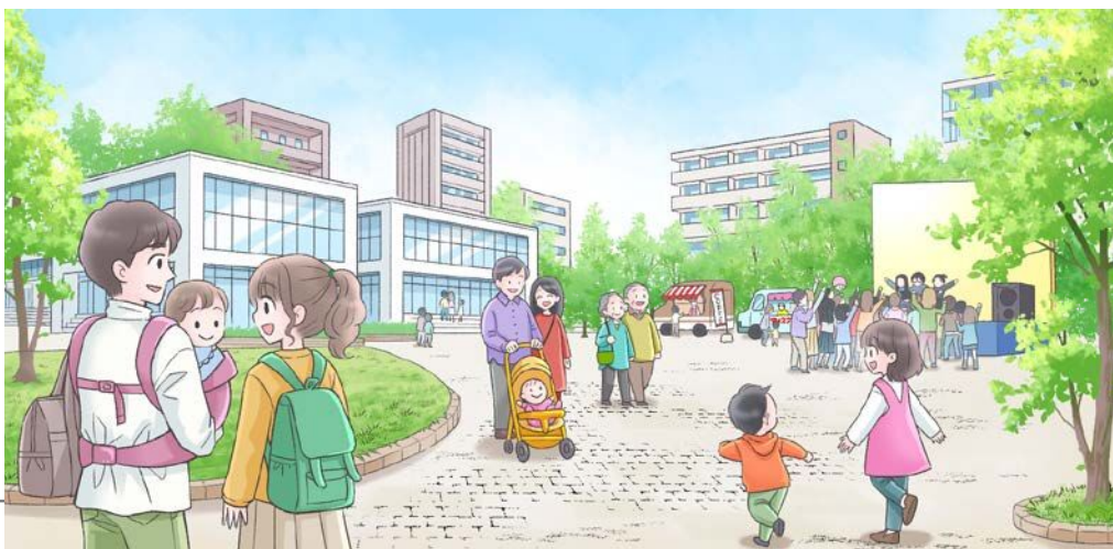
南流山駅南口広場の将来像の一例(イメージ)