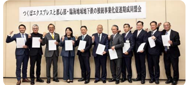
TXの東京駅延伸の実現を目指し、期成同盟会を発足させた沿線11市区の首長ら＝令和6年12月、守谷市役所で(井崎市長は左から5番目)

参加自治体(令和8年1月現在) ：つくば市、つくばみらい市、守谷市、柏市、流山市、三郷市、八潮市、足立区、荒川区、台東区、中央区、茨城県、千葉県 の13自治体