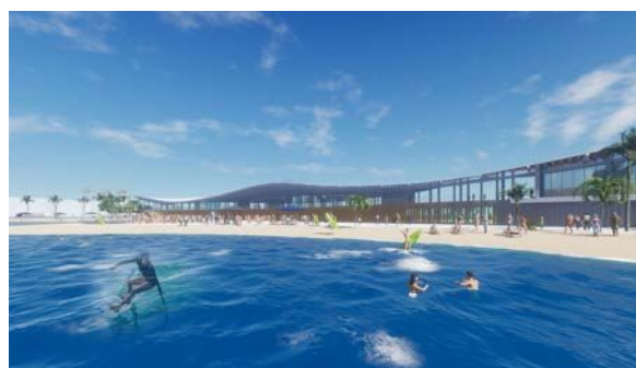
ウエーブプールのイメージ

ウエーブプールの周辺には地産地消によるファーマーズマーケット、飲食・物販店舗なども開設予定。ぜひ注目を！