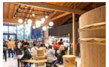
人々にぎわう白みりんミュージアム

3月29日、流山本町エリアに流山発祥の白みりんをテーマにした体験型公共施設「白みりんミュージアム」が開館しました。同ミュージアムは白みりん和流山の歴史をたどることができるパネル展示や、昔ながらのもちろみ仕込みを体験できるバーチャル体験など、五感で楽しく学べる施設です。12月11日には来館者数5万人を突破しました。