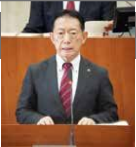
一般報告を行う井崎市長

11月27日、令和7年市議会第4回定例会の冒頭、井崎市長が19項目について市政の一般報告を行いました。そのうち、主なものを紹介します。市ホームページのサイト内検索ボックスにページID( ID1052062 ))を入力して検索すると、全文をご覧いただけます。