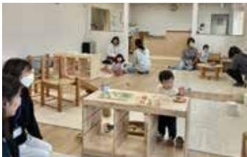
ぼっかぼかで遊ぶ親子

令和6年に開設した北部地区の地域子育て支援拠点「てるてる」に続き、東部地区に「ぼっかぼか」、南部地区に「ことこと」を開設し、未就学児と保護者が気軽に集い、遊びや相談ができる場を整えました。今後も、4月から始まった今後5年間の「流山市こども計画」に基づき、子どもの権利向上や幼保小連携などを計画的・一体的に進めていきます。