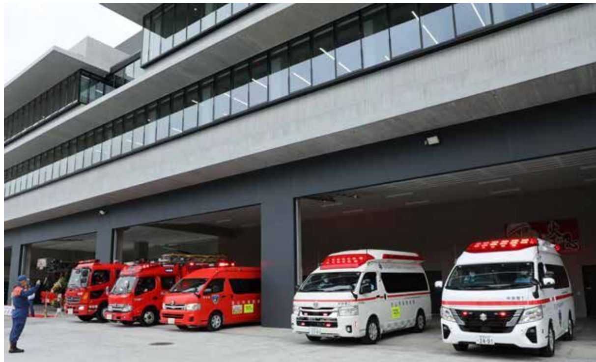
6月から新庁舎で業務を開始した消防本部・中央消防署

令和7年も残りわずかとなりました。今年は市民の皆さんにとってどのような1年だったでしょうか。