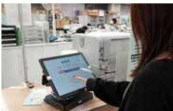
11月に導入された「書かない窓口」(市役所市民課)

11月からマイナンバーカードや運転免許証、在留カードを専用端末で読み取ることで、申請書の記入を一部省略できる「書かない窓口」サービスを一部窓口で開始しました。これまで進めてきた、マイナンバーカードとスマートフォンで証明書が取得できる「行かない窓口」サービスと併せて、利用者の負担をさらに軽減し、効率的な窓口対応を実現していきます。