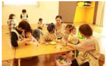
子どもの発達に合わせた教育・保育

令和6年に開始した保育園などへの補助に続き、私立幼稚園等要配慮児童受入支援補助金制度を設立し、要配慮児童を受け入れる私立幼稚園への補助を大幅に拡充しました。私立幼稚園の職員の加配や環境整備に対しても支援を広げることで、全てのお子さんの受け入れ先の選択肢を増やし、幼稚園も含めた「全入体制」の実現を目指します。