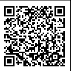
ふるさとチョイス