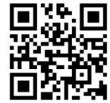
つうえんポータル

右記の二次元コードを読み込み、つうえんポータルにアクセスし、その画面にてお住まいの自治体を選択し、利用申請をしてください。