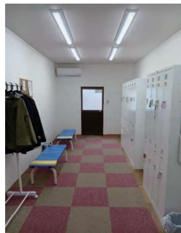
整備した女性専用更衣室