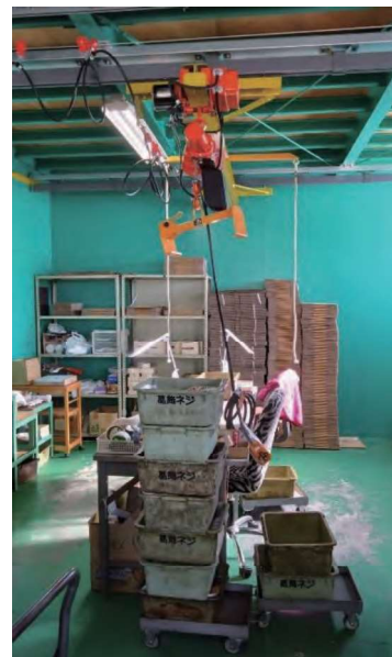
重量物を持ち上げる装置