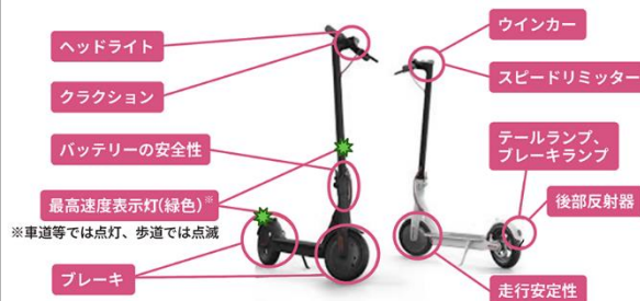
国土交通省HPより抜粋