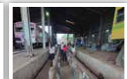
ピットエリアのイメージ