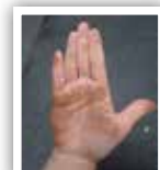
線路に触れた後の手

今回はこれまでと違い特別にライブステージ前に線路下のピットエリア(立ち席)をご用意します。車両の点検を行う場所であるピットエリアは、関係者以外入れない場所ですが、特別に開放します。車両基地のありのままの雰囲気を感じられ、停車中の電車を下から見る事ができるレアな空間の中で、迫力の生演奏と流鉄車両をお楽しみください。※線路がむき出しのため触れると汚れます。汚れてもよい服装でお越しください。