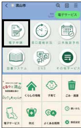
8月1日公開予定の画面イメージ

LINEで通知を受け取れる 受付完了などの通知は、従来メールでのみ受信できましたが、市LINE公式アカウントから申請をするとLINEのトーク画面で通知を受け取ることができます。