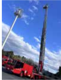
はしご車乗車体験