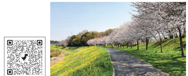
English translation 眺望の丘付近の桜並木

流山の春といえば、やはり利根運河も外せないスポットです。運河水辺公園を中心とした運河沿いでは、桜シーズンになると130本の桜が満開になり、辺りは優しいピンク色に包まれます。運河沿いの緑や菜の花の黄色とすてきに調和して、晴れた日はお花見やお散歩をする絶好の場所です。夜になると桜の開花に合わせて18時から21時まで15本の桜がライトアップされ、運河の水面に反射した桜はまたちょっと大人っぽい美しさに変わります。古くから大事にされている流山の春の景色は、今でもすてきな形で世界に誇れる宝物となっています。