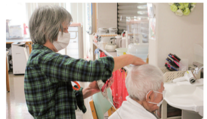
介護支援サポートの様子

6月に高齢者福祉センター森の倶楽部、7月に初石公民館、10月におおたかの森センター、12月に文化会館、令和7年1月に東部公民館でも実施する予定です。