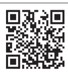
ながいき100歳体操の動画