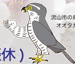
流山市の鳥 オオタカ

主催：利根運河交流館、流山おおたかの森駅前観光情報センター、流山市立森の図書館、流山市立博物館 協力：流山市観光協会