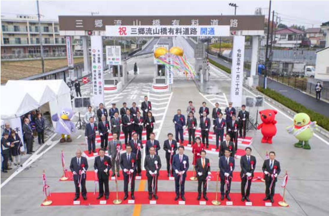
11月26日、三郷流山橋有料道路の開通を記念したテープカットとくす玉開披が行われた

令和5年も残りわずかとなりました。今年は市民の皆さんにとってどのような1年だったでしょうか。