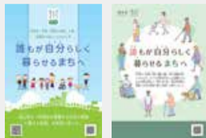
リーフレットは子ども用(左)と中学生以上用(右)の2種類を作成

4月1日、性別等、年齢、障害の有無、人種、国籍等の違いにかかわらず、全ての市民が自分らしさを発揮できるまちの実現を目指した「流山市多様性を尊重する社会の推進に関する条例」が施行されました。市では引き続き、市内在住・在勤・在学の方々や市内で活動する団体の皆さんと協力し、基本理念の実現に向けて市全体で取り組みます。