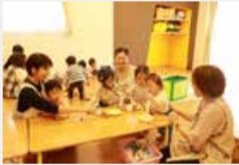
子どもの発達に合わせた保育

10月から受け付けを開始した令和6年度の入所手続きについて、障害者手帳や通所受給者証の交付を受けた児童などが円滑に入所できるよう、各認可保育施設に要配慮児童の受け入れ枠を設定しました。また、事前面談の実施や受け入れる認可保育施設への支援拡充を行う予定です。なお、令和6年度からは(仮称)障害児対応コンシェルジュを新たに配置し、事前面談や入所後のフォローなどを行うことを検討しています。