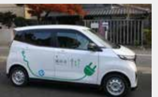
公用車として導入している電気自動車「サクラ」

2月16日、2050年度までに、全ての市民や事業者が脱炭素型のライフスタイルや事業活動を取り入れ、二酸化炭素排出量実質ゼロのまちを目指す「ゼロカーボンシティ」を表明しました。市では、公用車の一部に電気自動車を導入するほか、太陽光発電設備や蓄電システム、電気自動車・プラグインハイブリッド自動車、断熱窓、エネファームなどの設置、購入費用の一部の補助などを実施しています。市民、事業者、行政が一体となって、省エネルギー生活への転換や再生可能エネルギー活用への促進に向け、今後さらに取り組みを進めていきます。