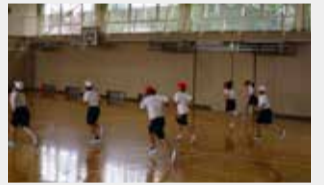
快適な環境で授業に臨む児童

災害時に避難所として指定されている公立学校体育館の防災機能強化を国が各市町村へ要請していることを受け、本市では、3月～6月にかけて工事をを行い、市内公立全27小・中学校の体育館に空調設備を設置しました。災害時の停電を想定し、電源自立型の室外機を各校1台設置していることから、停電時でもエアコンの稼働やLED照明の使用、非常電源の確保が可能で、児童・生徒の熱中症対策はもちろん、災害時に地域住民の安心・安全を提供する場として活用されます。