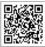
国税庁ホームページ

確定申告書は、お近くの税務署や市役所市民税課(1月下旬～3月15日の平日)、文化会館(2月16日～3月15日の平日)で配布します。また、国税庁のホームページでは1月下旬からダウンロードできます。※確定申告書の配布部数には限りがあります。