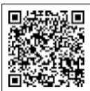
確定申告書等作成コーナー

マイナンバーカードとマイナンバーカード読み取り対応のスマートフォンやICカードリーダーが有れば、スマートフォンやパソコンで確定申告ができます。マイナポータルと連携して医療費、ふるさと納税、給与、年金の源泉徴収票などの情報を自動入力することができるため、自分で計算する必要もありません。ぜひご利用ください。