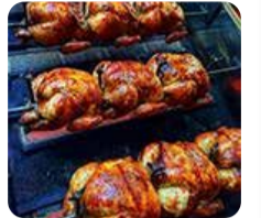
ビストロ ミナミンカゼ・ローストチキン