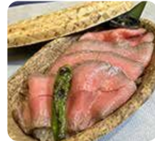
ブラスリー・しんかわ・和牛のローストビーフ丼