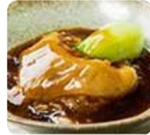
中国料理 文菜華・気仙沼産 ぶかひれ姿煮どんぶり