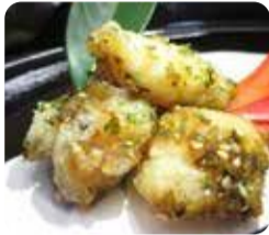
相馬市・あんこうの唐揚げ