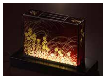
左:「透明な花」、右上:「透明な花」の内部、右下:「秋草」