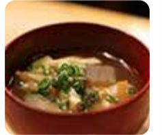
流山すず季・蕎麦掻き入り けんちん汁