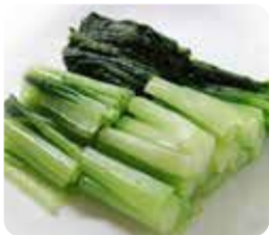
信濃町・野沢菜漬け