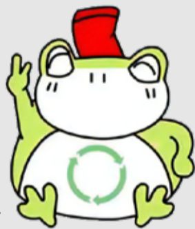
流山市ごみ減量・資源化キャラクターケロクル

お菓子の袋など広がりやすいものは、小さく折り畳むか短冊切りにするのも効果的です。ただし、短冊切りにする際は、細かく切りすぎると資源化できなくなる恐れがあるので、3~4センチメートル程度を目安に切りましょう。