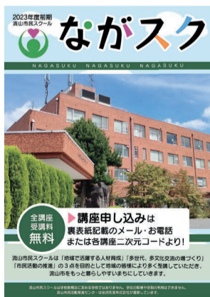
「ながスク」パンフレット