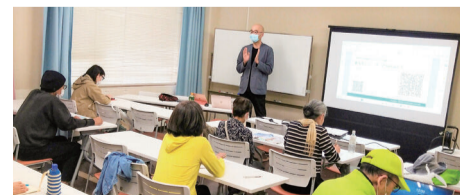
過去のSNS講座シリーズの様子

こちらの講座は令和5年度後期の「ながスク」パンフレットに掲載予定です。詳細は市民活動推進センターにお問い合わせください。