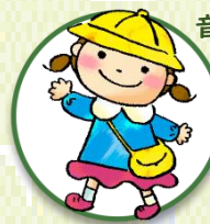
音楽・リトミック