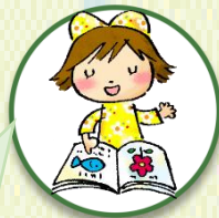
体育・英語・食育

◎それぞれの年齢に合わせてひも通し・スナップボタンつなぎパズルなど遊びを通じた学習をしています就学前には文字かるたなど多様に取り入れております。