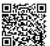
イベントの詳細はコチラ

噴水ショーで涼味を楽しむ4日間、森の ナイトカフェが今年も開催されます。 幻想的な雰囲気の中で、おいしい食事 やウォーターアトラクションなど暑い真 夏の夜を楽しんでみませんか。 問マーケティング課☎7150-6308