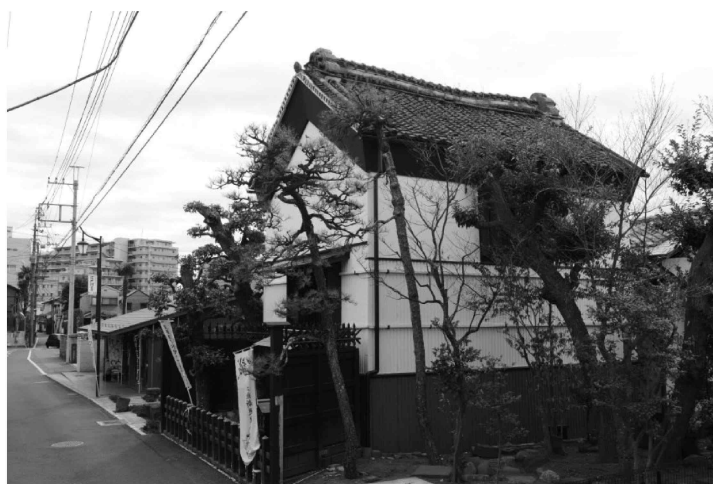
国登録有形文化財「秋元家住宅土蔵」