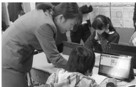
タブレット端末を活用した学習

流山市の学校教育においては、「生きる力」を育むという理念を踏まえ、児童生徒一人一人が生き生きと学べる豊かな教育活動を実践します。そして、子どもたちの可能性を引き出す教育の実現を目指していきます。また、流山の子どもたちが自信を持ち、いろいろなことに挑戦し、未来に活躍できる「自立・自律」した子どもが育つよう、流山の教育を推進します。