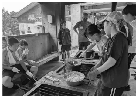
2泊3日の宿泊体験「チャレンジキャンプ」