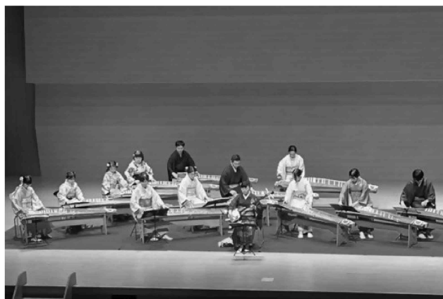
文化芸術の祭典「流山市文化祭」