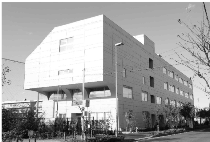
令和4年12月にオープンした「南流山地域図書館」