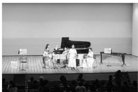
赤ちゃんが泣いても気にしない。 公民館「子育てコンサート」