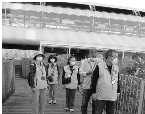
青少年指導センター補導員による街頭パトロール