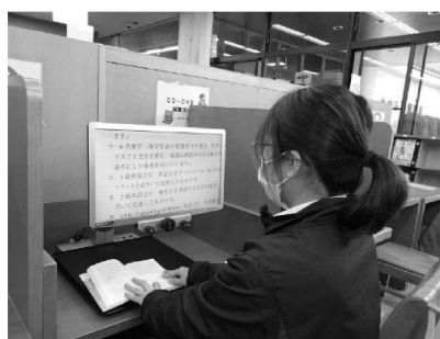
文字を拡大する等の機能がある 読書支援機器「拡大読書器」