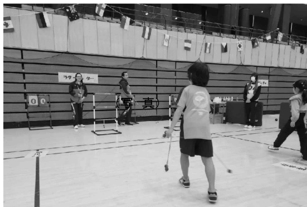
ユニバーサルスポーツ「ラダーゲッターの体験会」