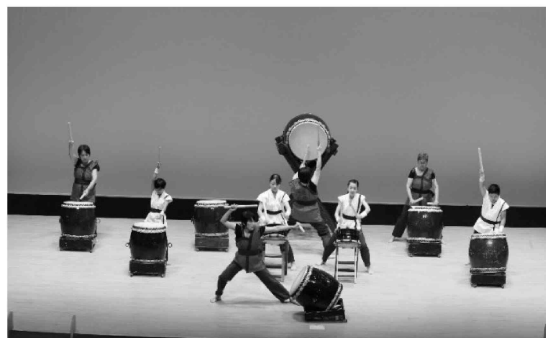
流山市文化祭「オープニングイベント」

生涯学習においては、豊かな人生につながる生涯学習の推進と文化芸術の醸成・歴史の継承、スポーツの振興を目指して、市民の学習要求に応える機会と場を提供していきます。そして、地域の環境づくりとともに、文化芸術・歴史・スポーツに親しむ機会の創出のために、事業を推進します。