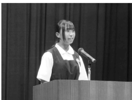
青少年が抱負等を発表する「青少年主張大会」