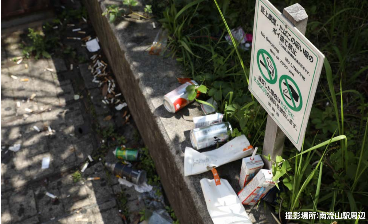
撮影場所:南流山駅周辺