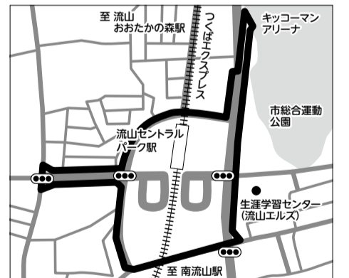
流山セントラルパーク駅周辺