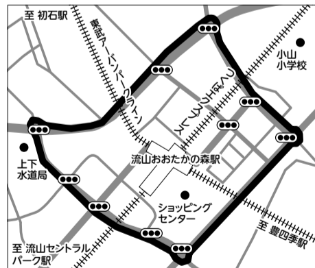
流山おおたかの森駅周辺(駅構内自由通路を含む)