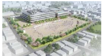
市野谷小学校の完成イメージ

▷応募方法=市役所学校教育課、各出張所、各公民館、各図書館、生涯学習センター(流山エルズ)に設置する所定の応募用紙(市ホームページからダウンロード可)に必要事項を明記の上、5月15日(必着)までに☎270-0192流山市役所学校教育課に郵送、メールまたは直接窓口へ ☎学校教育課 7150-6104 ✉gakkoukyouiku@city.nagareyama.chiba.jp 校名の決定について…ID 1036626 校章デザインの募集について…ID 1040246