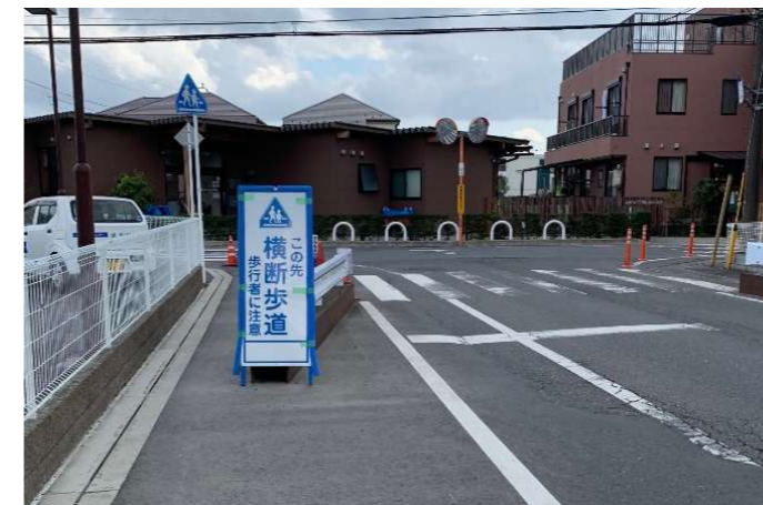
旧たけのこルーム前T字交差点