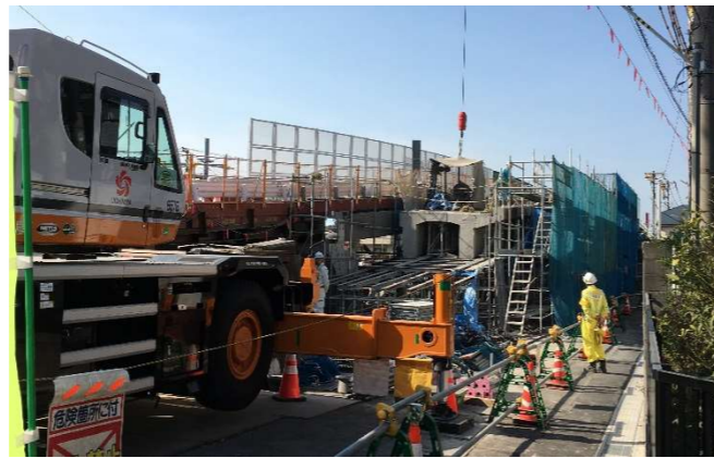
工事の施工状況(古い橋梁の撤去状況)