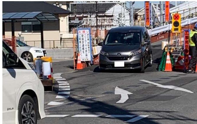
工事用信号による交通処理状況