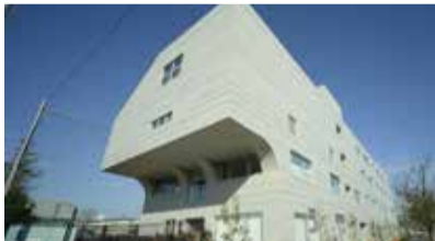
南流山地域図書館・南流山児童センターの複合施設

南流山児童センターには、ゆうぎ室、工作室、体育室を設けるとともに、子育て相談室や一時預かり室を備え、子育てをサポートする環境が整えられています。