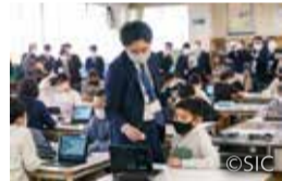
東小学校で行われたプログラミング教育の公開授業

東京理科大学、(株)内田洋行、(株)ソニーインタラクティブエンタテインメントの協力のもと、市内公立小・中学校で産官学連携によるプログラミング教育を行っています。手のひらサイズのプログラミング教材ロボット「toio™」を小・中学校を通して活用し、論理的な思考を楽しく学ぶことから、プログラミングの基礎を学ぶことまで、ステップアップ型での指導を実践しています。