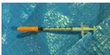
集積所に排出された注射器の一例

在宅医療で使用した注射針がごみ集積所に排出されたり、クリーンセンターに持ち込まれたりする事例が発生しています。排出された