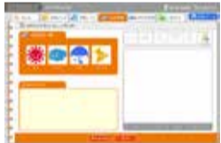
その日そのときの気持ちを天気に例えて記録する「心の天気」

市では、ICT機器を活用した全国的にも先進的な取り組みを進めています。4月には出欠や保健情報、成績・指導計画をまとめる校務系データと、学習ドリルデータや子どもたちのその日そのときの気持ちを天気为例えて記録する「心の天気」などの学習系データを連携させるシステムを構築しました。これにより、児童・生徒一人ひとりに合ったよりきめ細かな指導ができるようになりました。