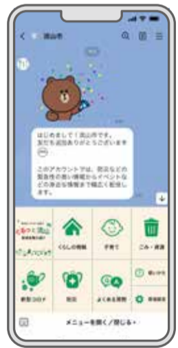
9月1日からスタートした流山市LINE公式アカウント

「流山市LINE公式アカウント」のサービスが9月1日にスタートしました。12月15日現在、1万1,700人を超える方が友だち追加されているLINE公式アカウントでは、災害情報や感染症情報など15種類の項目から欲しい情報を選んで受け取ることができます。また、LINEのトーク画面の下部のメニューからは、子育て情報やごみの分別情報などのお役立ち情報をチェックできます。