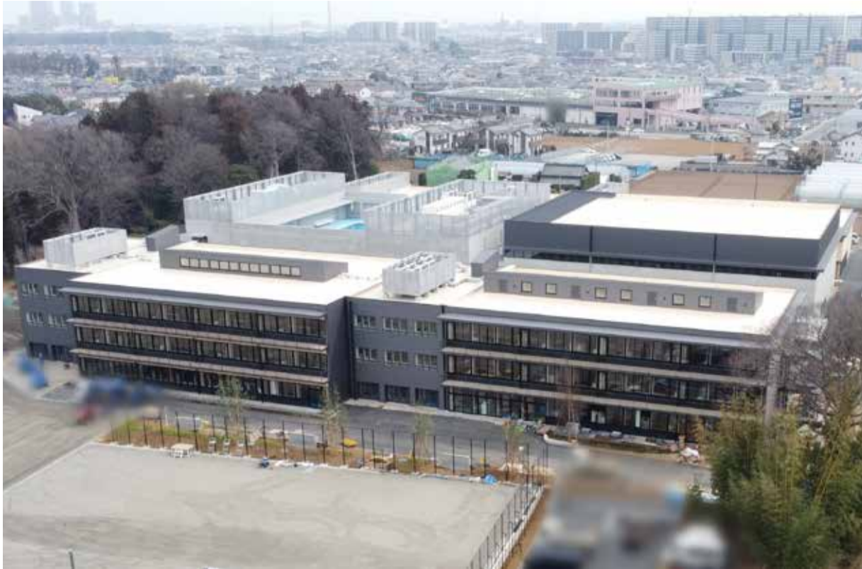
4月に開校したおおぐろの森中学校