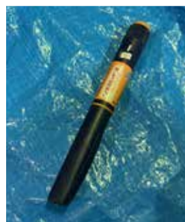
集積所に排出されたペン型注射器の一例