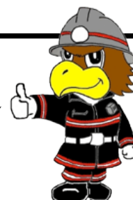
流山市消防マスコットキャラクター おおたか君

寝たばこで布団から発煙。寝室に設置していた住警器が鳴ったことで、居住者が目を覚まし、布団を消火することに成功したケースもあります。必ず住警器を設置しましょう。