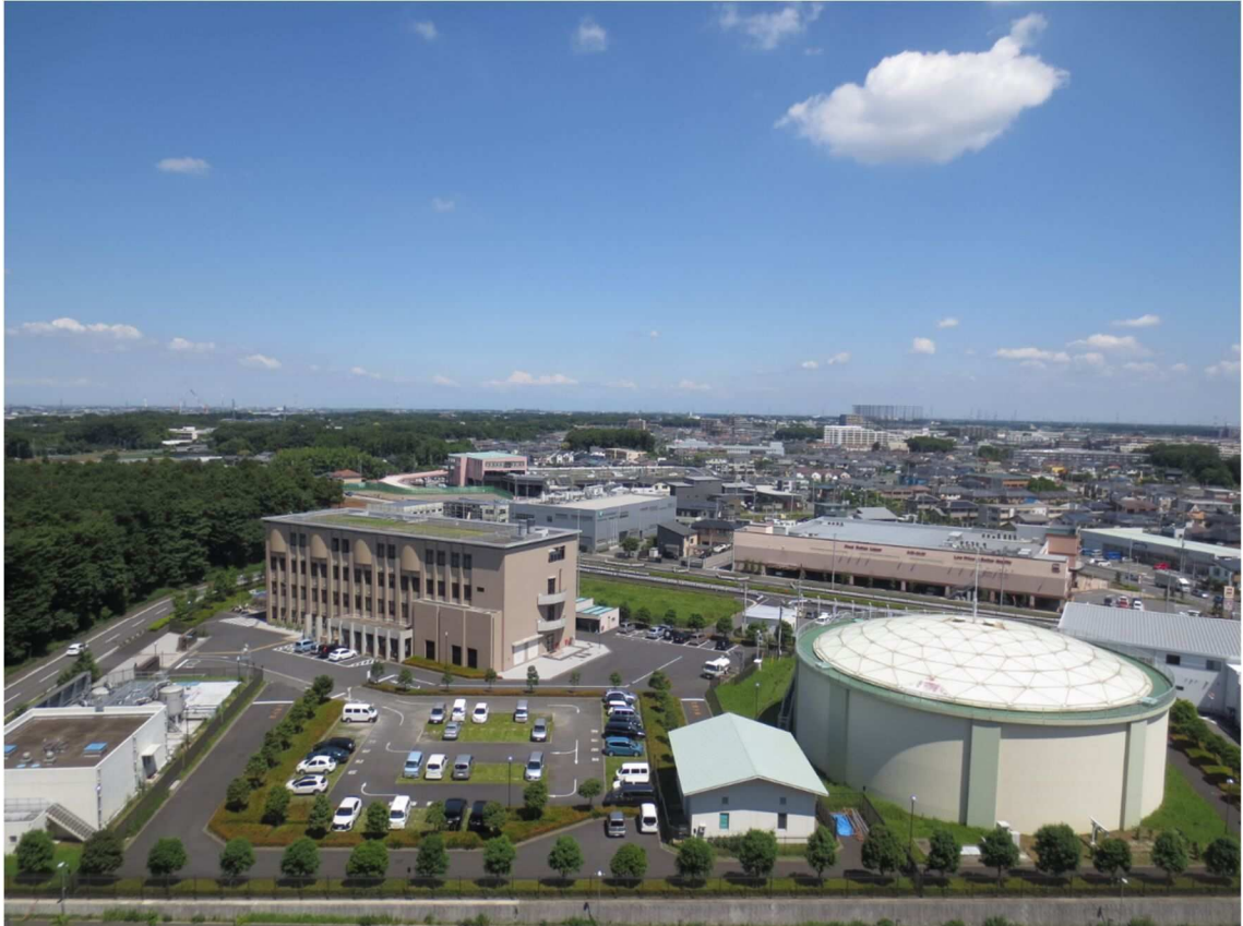
流山市上下水道局