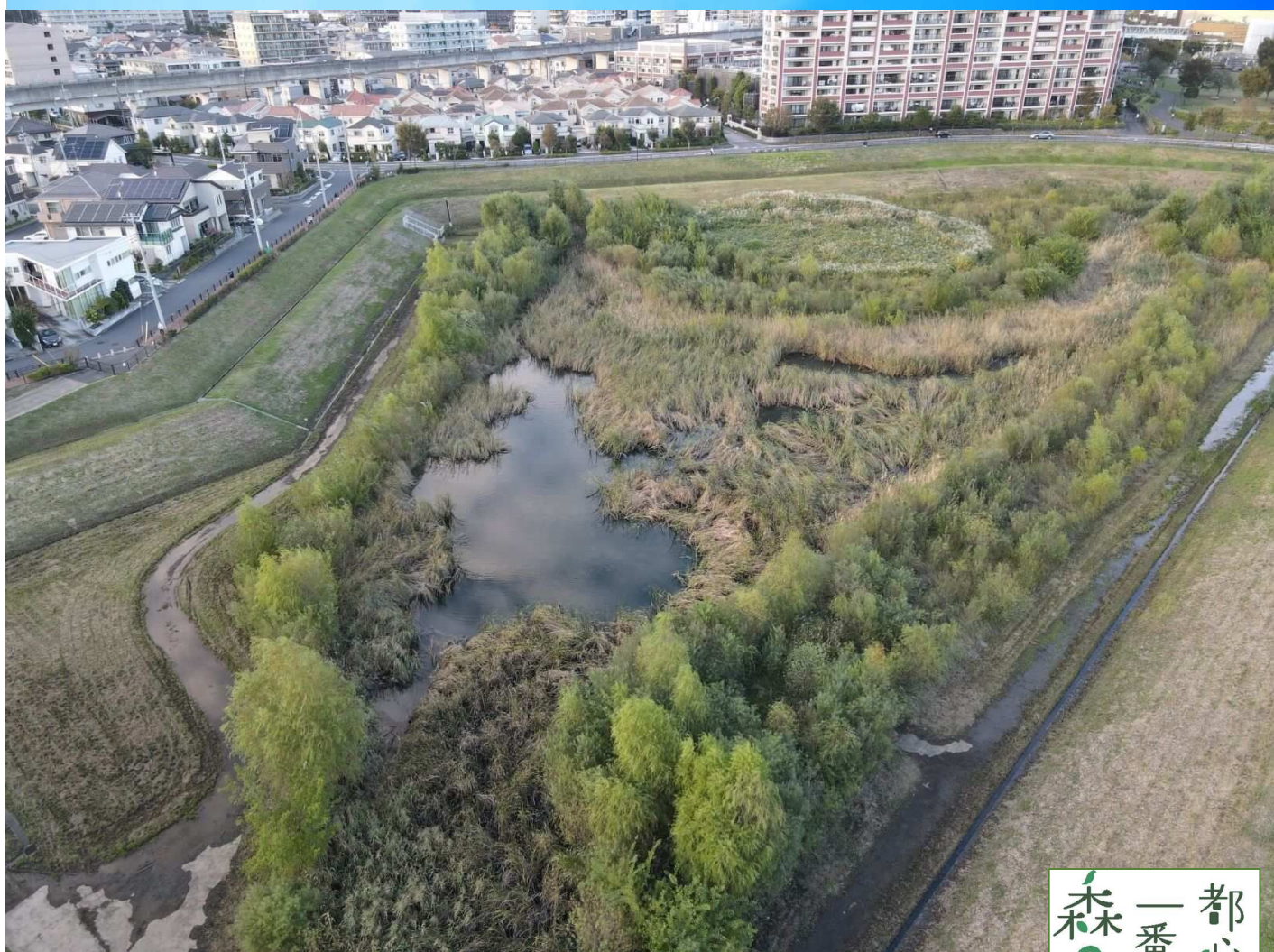
市野谷調整池 （市野谷水鳥の池）