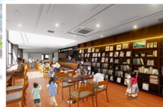
併設するカフェのイメージ