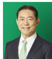
流山市長 井崎 義治

市では引き続き、つくばエクスプレス沿線はもとより市全域において、市民の皆さまにとって「住み続けたい街」、市外の方々から「住みたい街」として、「住み続ける価値」を高め、全国から選ばれ、愛されるまちづくりを進めてまいります。