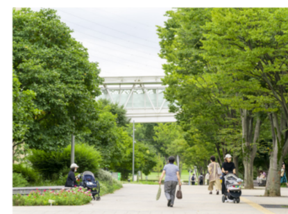
森のプロムナード