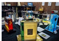
令和2年開催「第11回世界のきらめき万華鏡展」の作品