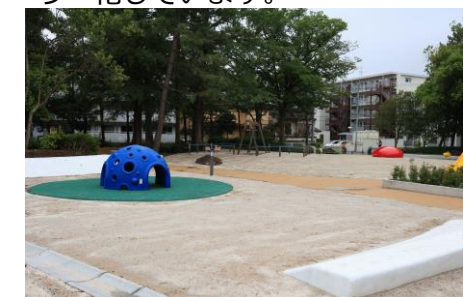
拡張した遊具広場です。周辺には緩やかな傾斜がある台があり、自由な発想で遊べます。