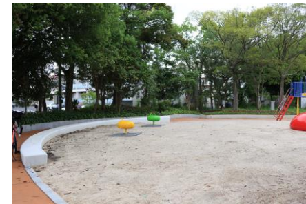
遊具広場の周囲には見守りができるベンチがあります。