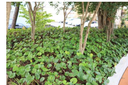
公園の外周にある植栽の低木を整理し、地被類に変更することで公園内外の見通しの改善を行いました。