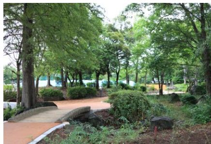
橋などの活用できる既存の公園施設はそのまま活用しています。