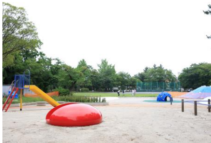
遊具広場を奥まで拡張しました。