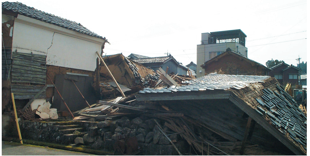
平成19年能登半島地震で倒壊した住宅(姉妹都市市石川県能登町の様子)