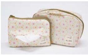
ティッシュポーチとコスメポーチ

春の流山本町のおさんぽを楽しみながら協力店舗をめぐると、数量限定の「ことりっぷ流山本町」オリジナルノベルティ(=写真)がゲットできる「流山本町おさんぽキャンペーン」を実施します。