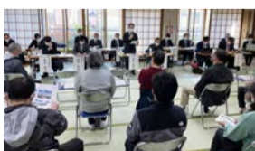
昨年12月に開催されたタウンミーティング

また、「住み続ける価値の高いまち」を目指し、緑豊かな「良質な住環境」「快適な都市環境」を創出します。