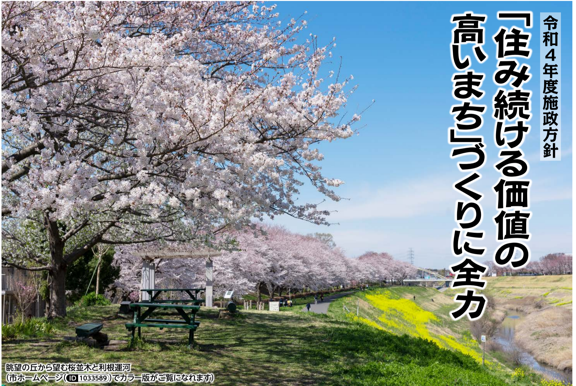
眺望の丘から望む桜並木と利根運河 (市ホームページ(ID 1033589)でカラー版がご覧になれます)