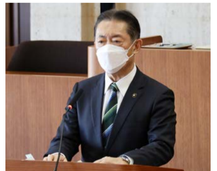
問秘書広報課☎7150-6063 ID 1033509