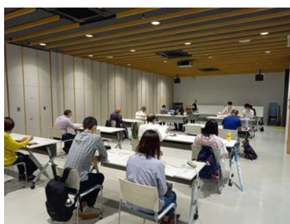
ボランティア説明会の様子