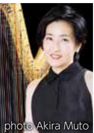
吉野直子