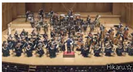
Hikaru.☆ 桐朋学園オーケストラ

緊急事態宣言およびまん延防止等重点措置が9月30日をもって解除されたことから、10月31日に開催予定のNAGAREYAMA国際室内楽音楽祭2022プレコンサートの定員を拡大してチケットを販売します。質の高いクラシックを鑑賞してみませんか。