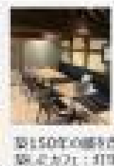
築150年の歴史ある民家カフェ；町屋