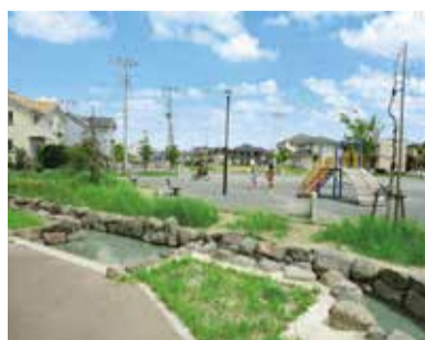
西平井・鱒ヶ崎地区

※千葉県の宅地は、敷設していません。詳細は千葉県流山区画整理事務所にお問い合わせください。