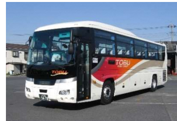
東武バスセントラル

当路線は、近年急速に発展し続けている「柏の葉」、子育て世帯から住みやすい街として注目を集めている「流山おおたかの森」と東京駅を乗り換えなしで繋ぐ新路線です。