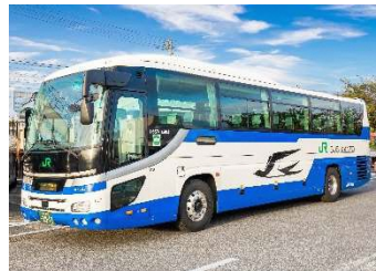
ジェイアールバス関東