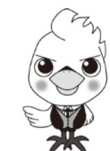
流山市けんしんPRキャラクター「ウケタカくん」

検診は「自覚症状等のない健康な人」から「異常のある可能性の高い人」を選び出し、疾患の早期発見・治療につなげるものです。人間ドックや会社の健診等他で受ける機会のある方はそちらでお受けください。