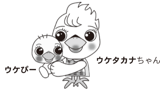
流山市けんしんPRキャラクター「ウケタカナちゃんとウケピー」