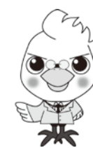
「ウケタカくん」 「ウケタカナちゃん」

血液検査による腎機能検査、貧血検査、心電図(対象基準：現在高血圧、高血糖、脂質異常症の服薬治療をしていない方で、医師が心電図検査を必要と認めた方。)