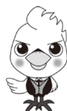
流山市けんしんPRキャラクター「ウケタカくん」

検診は「自覚症状等のない健康な人」から「異常のある可能性の高い人」を選び出し、疾患の早期発見・治療につなげるものです。人間ドックや会社の健診等他で受ける機会のある方はそちらでお受けください。自覚症状のある方は、検診ではなく、早めに医療機関で受診してください。現在治療中もしくは経過観察中の方は検診を受ける必要はありません。