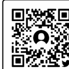
Twitter市スポーツ振興課公式アカウント

ツイッター Twitter市スポーツ振興課公式アカウントが開設しました。本アカウントでは、市のスポーツに関する情報をお届けします。オリンピック・パラリンピック関連の最新情報も発信しますので、イベントの前には必ずチェックしてください。