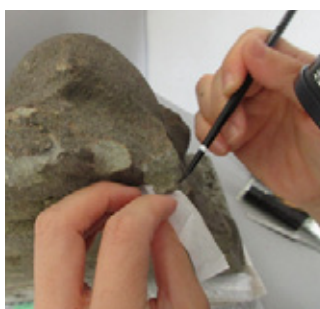
光背の接着作業の様子

文化財の修復にあたっては、「オリジナル(本物)と補強部分が判別できるように」というルールがあるため、修復に使用する材料は、オリジナルとは異なる素材を使用します。しかし、鑑賞の妨げにならないように修復することも求められるので、全く違う色や質感の材料を使用するのではなく、美観を考慮し、オリジナルのように調整した修復材料を使用しました。