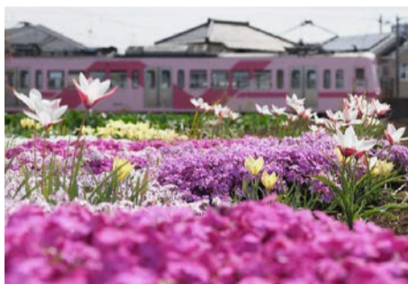
「芝桜とチューリップと流鉄さくら号」