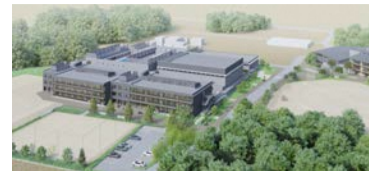
おおぐろの森中学校完成イメージ図