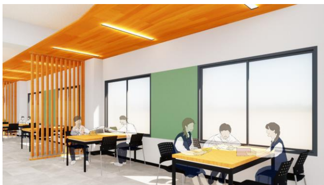
A棟コミュニケーションスペースイメージ図