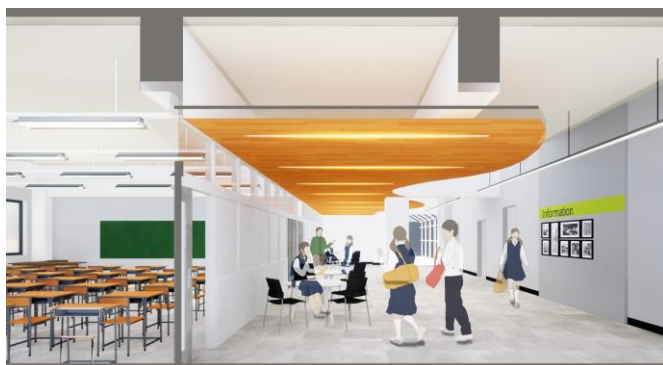
C棟コミュニケーションスペースイメージ図

教室を配置するA棟・C棟・E棟には、旧大学施設の空間を活用し、「コミュニケーションスペース」を設けます。教室前廊下と一体的に整備するコミュニケーションスペースは、生徒による発表・展示などのアクティビティや、グループ活動などの「対話的な学び」の空間に利用することができ、多様な学習形態・学習環境を実現します。