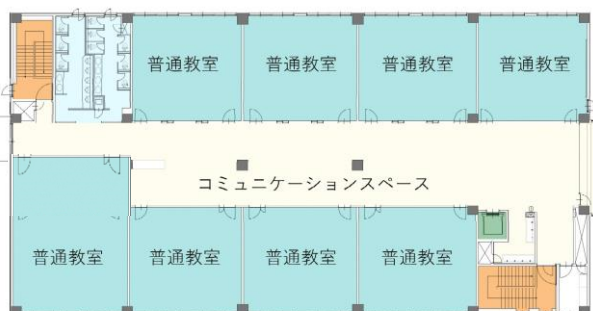
教室周辺の平面イメージ図

また、E棟の2・3階には「少人数教室」を配置し、少人数学習や個に応じた学習などに対応できる、自由度の高い学習空間とします。