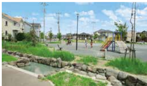
西平井・鱈ヶ崎地区

*千葉県の宅地は、敷設していません。詳細は千葉県流山区画整理事務所にお問い合わせください。