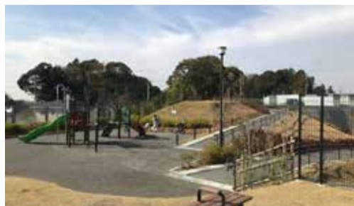
鱈ヶ崎・思井地区