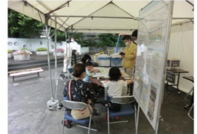
感染症対策を実施したオープンハウス (当社実績)