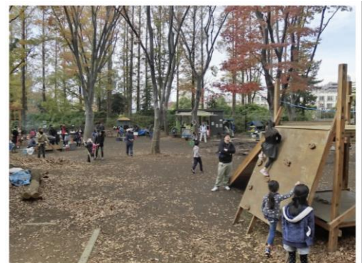
しながわ区民公園プレイパーク (当社実績)