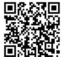
「警戒レベル」を用いた避難情報等の運用開始について