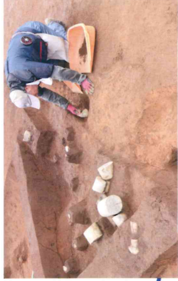
縄文時代の石棒(祭りの道具)が出土 (約4,500年前)