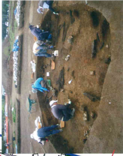
火災となった古墳時代の住居跡から 土器や炭化した柱が出土 (約1,700年前)