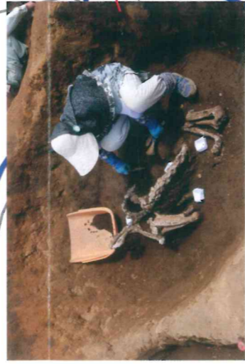
江戸時代のシシ落しから 馬の骨が出土 (約300年前)