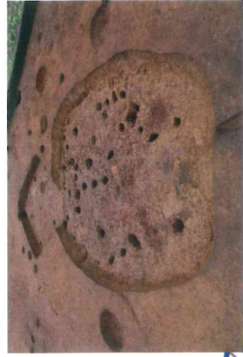
縄文時代前期の住居跡 (約6,300年前)