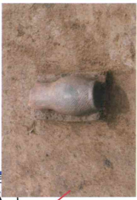
床面から出土した小形壺 (約1,800年前)