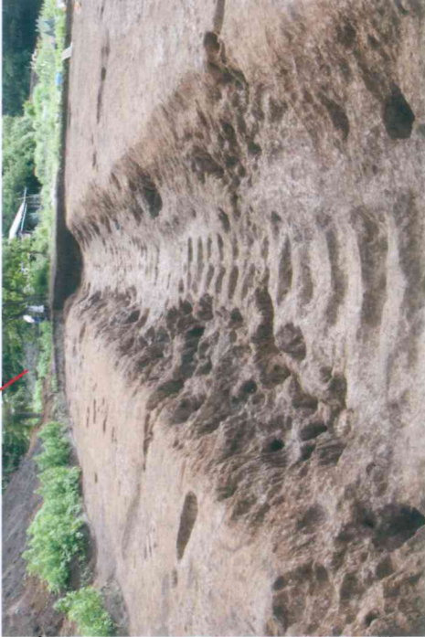
中世から近世まで使われていた大群村の道路跡 (約300~500年前)