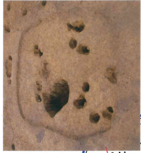
弥生時代の住居跡