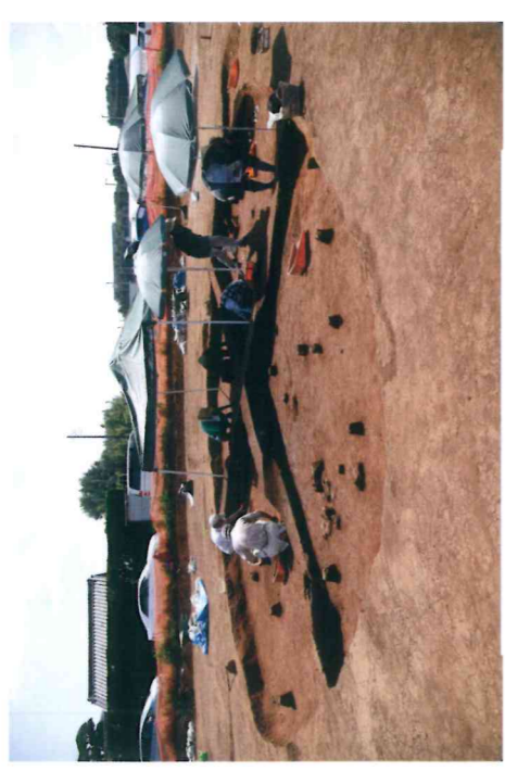
弥生時代の住居跡の調査状況 (約1,800年前)