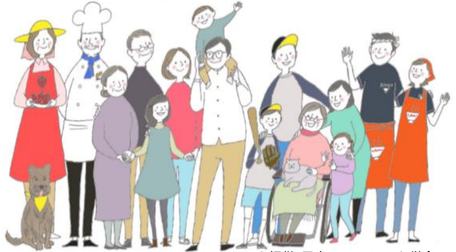
イラスト提供：日本ユマニチュード学会

優しさを伝えるケア技法、ユマニチュードについて、基本的な考え方と技術についてご紹介いたします。認知症の方とより良い関係を築くために学んでみませんか？